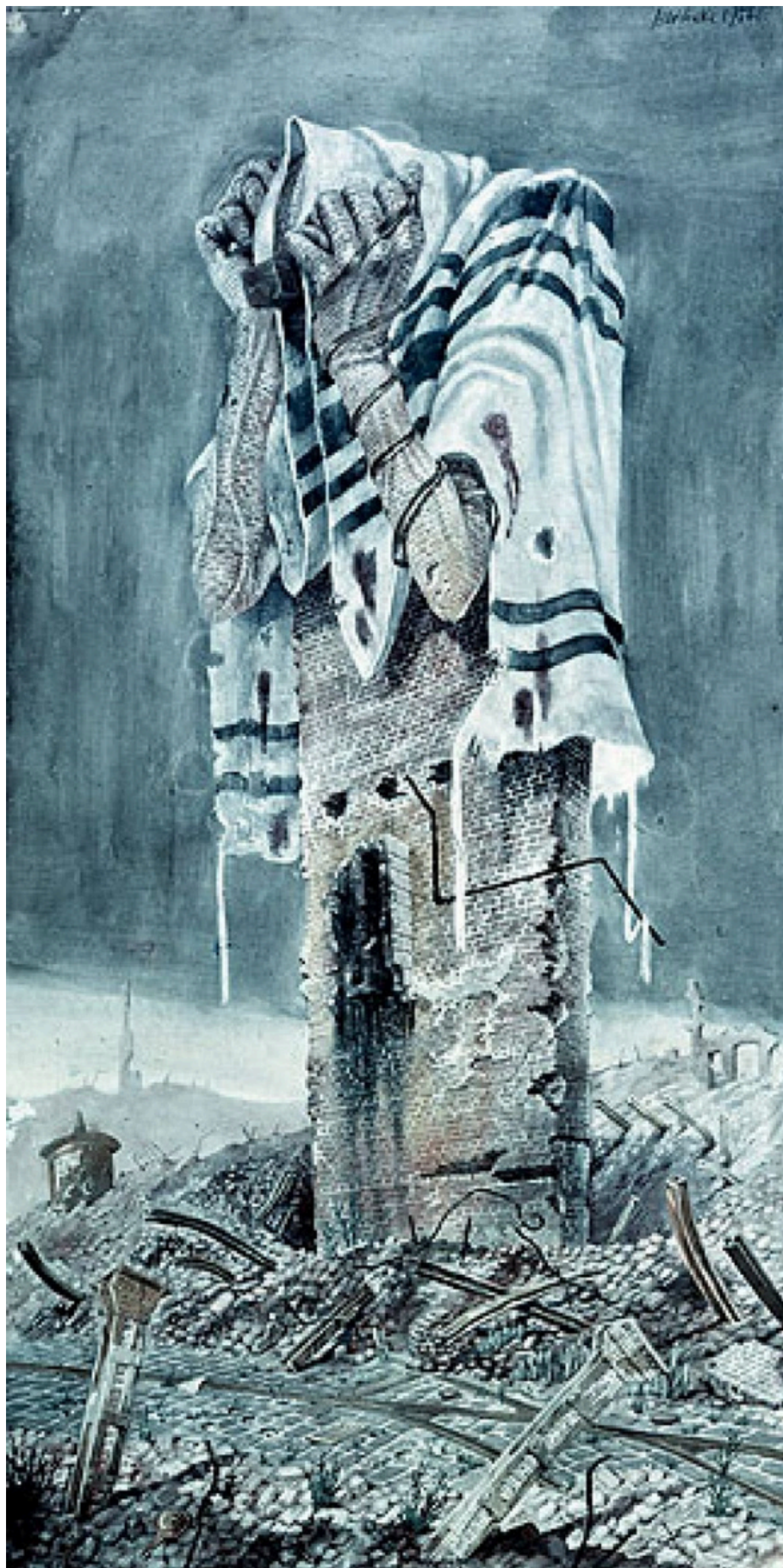
Bronisław Linke - „El mole rachim” (1946)