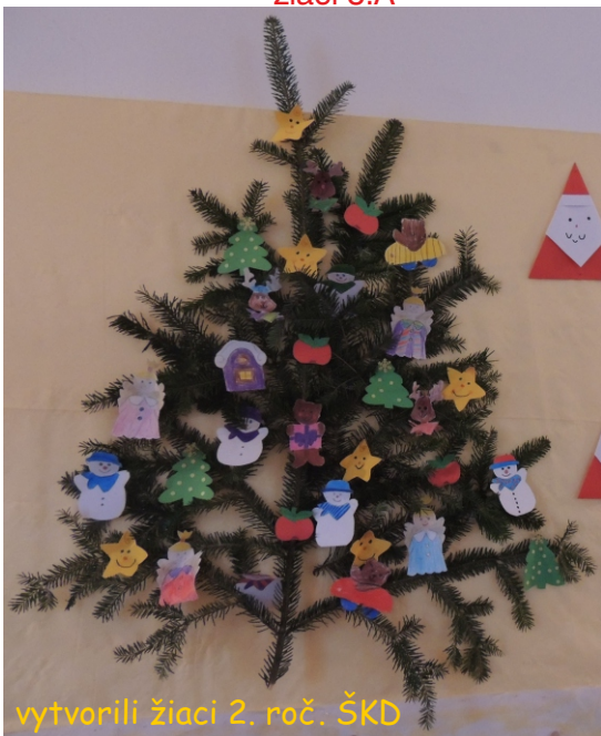
vytvorili žiaci 2. roč. ŠKD