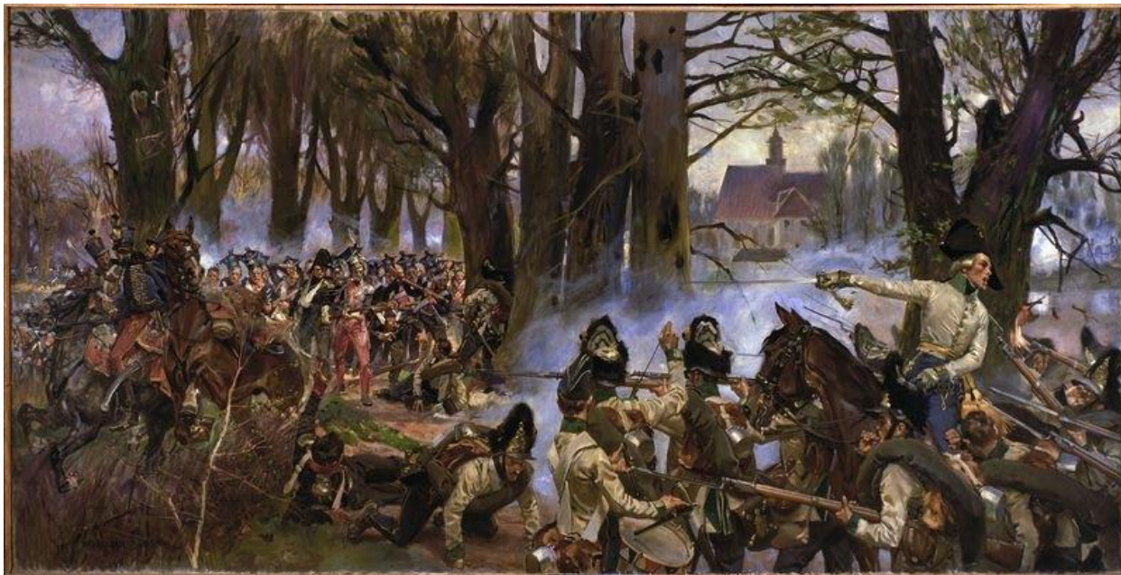
Bitwa pod Raszynem, obraz Wojciecha Kossaka, 1913. Muzeum Narodowe w Warszawie