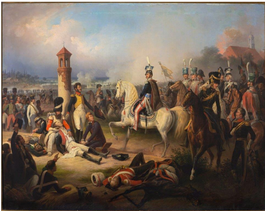
obraz „Śmierć Cypriana Godebskiego pod Raszynem”, 1855 Autor: Januariusz Suchodolski (1797-1875)

Bitwa 1809 r. którą dowodził książę Józef Poniatowski uwieczniona została na obrazach Wojciecha Kossaka i Aleksandra Gieryskiego. Opisał ją także Stefan Żeromski w słynnych Popiołach .