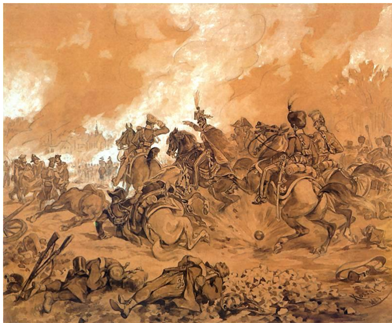
Bitwa pod Raszynem, szkic Juliusza Kossaka, 1884.