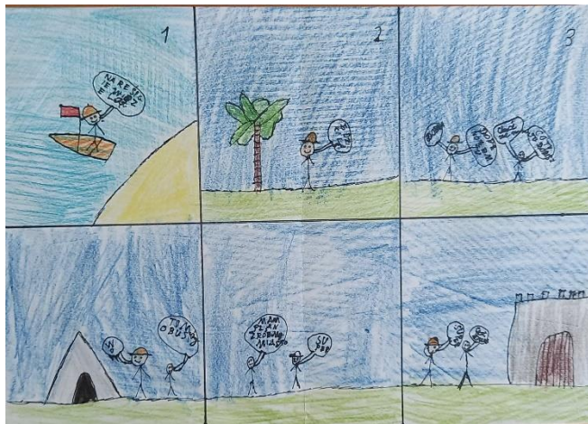
wyk. Igor Bzinkowski