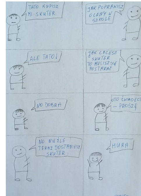
wyk. Ksawery Spadło