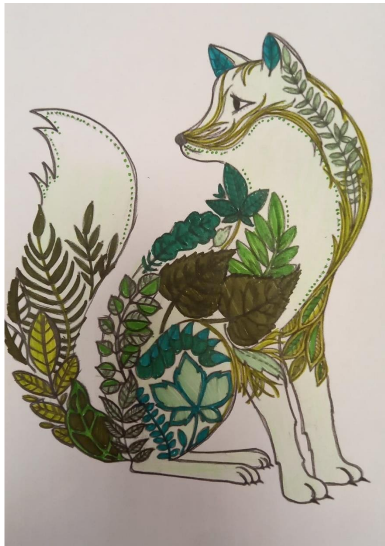
wyk. Iga Stefańska kl. III