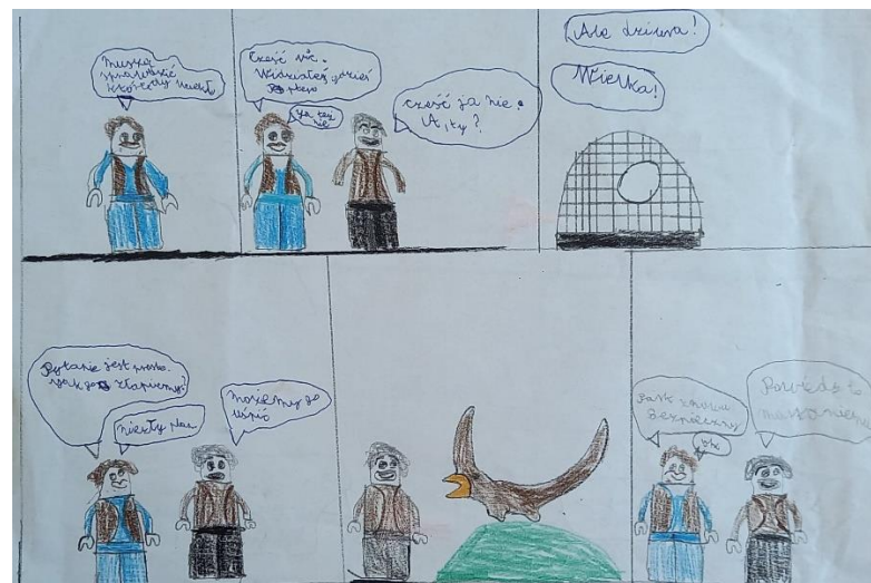
wyk. Kacper Obarski