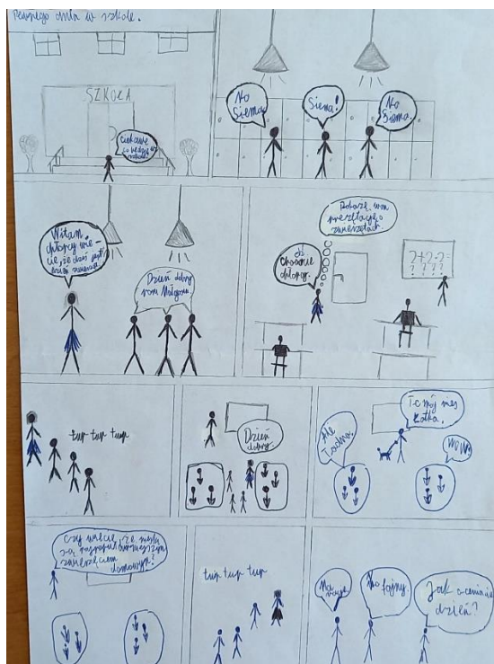
wyk. Bartłomiej Puchalski kl. V