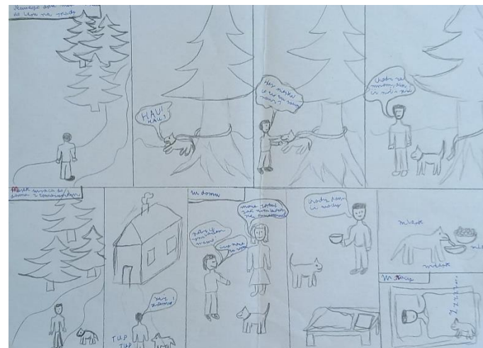
wyk. Stanisław Firkowski