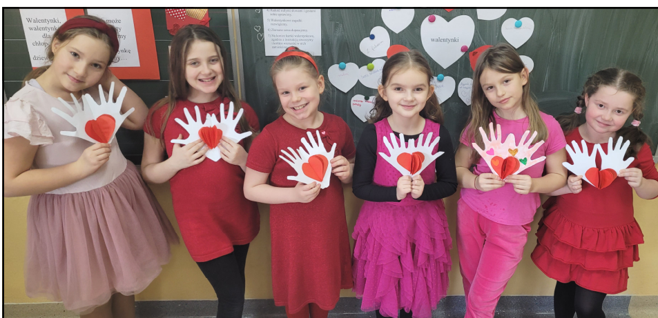
Dziewczynki z klasy II c prezentują własnoręcznie wykonane i pomysłowe kartki walentynkowe. Tytuł prac to - „Serce zamknięte w dłoniach” - łatwo i szybko je zrobisz; spróbuj, a sam się przekonasz...