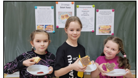
Tostowa ucza w klasie II c...