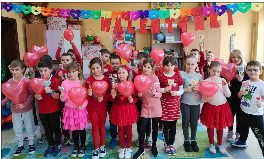
Dzieci z klasy II b trzymają balony i lizaki w kształcie serduszek oraz mają wesołe minki, bo to przecież walentynki!