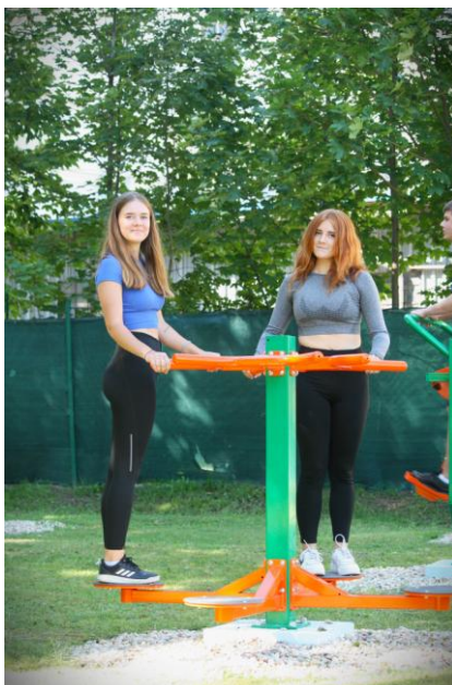
Pripravila: Mgr. Martina Derdziaková