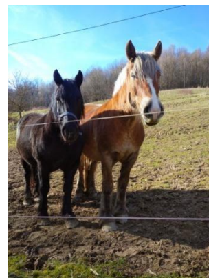
Obr.6 Santa a Hviezda

Priateľstvo koňa a človeka – Prvoradé by malo byť zabezpečenie konskej spoločnosti. Kôň osamote jednoducho nemôže byť spokojný. Oslík alebo ovečka nie sú plnohodnotnou náhradou – ak si nemôžeme dovoliť chovať aspoň dva kone, tak radšej zvolíme nájomnú stajňu alebo si nekupuje vôbec žiadneho koňa. Je potrebné zabezpečiť adekvátne veľký priestor (aspoň 1 ha na koňa), dostatok potravy a vody a ich vhodné rozmiestnenie. Kone nechávame spolu ideálne neobmedzene. Takto chované kone sú skutočne spokojné, vyrovnané a naozaj nevyhľadávajú vzájomné konflikty. V skutočnosti je základnou sociálnou jednotkou koní rodinná skupina. Tú tvorí zvyčajne žrebec, jeho pár kobýl a ich nedospelí potomkovia. Rodinná skupina spolu žije takmer celý život vo viac-menej nezmenenej podobe, iba potomkovia odchádzajú.