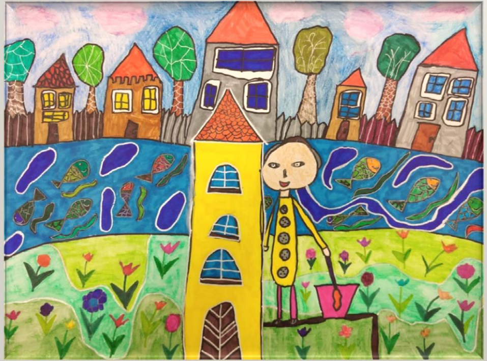
Cserge Rita – 1. osztály