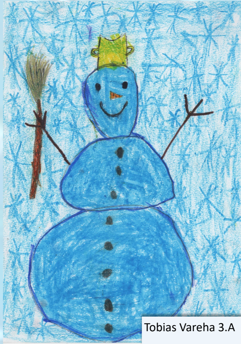
Tobias Vareha 3.A