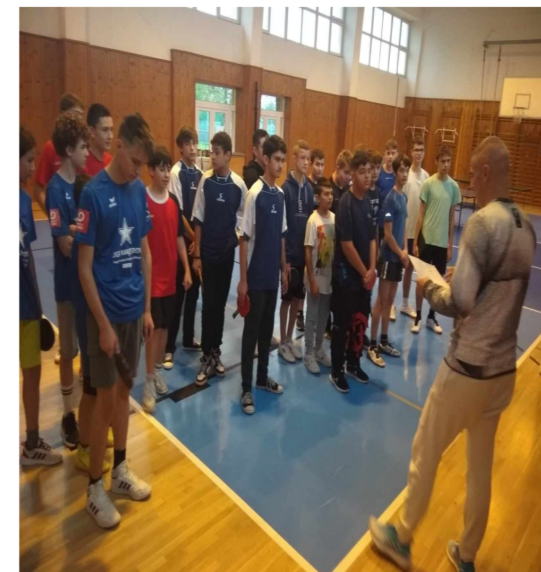
Okresné kolo v stolnom tenise chlapcov a dievčat