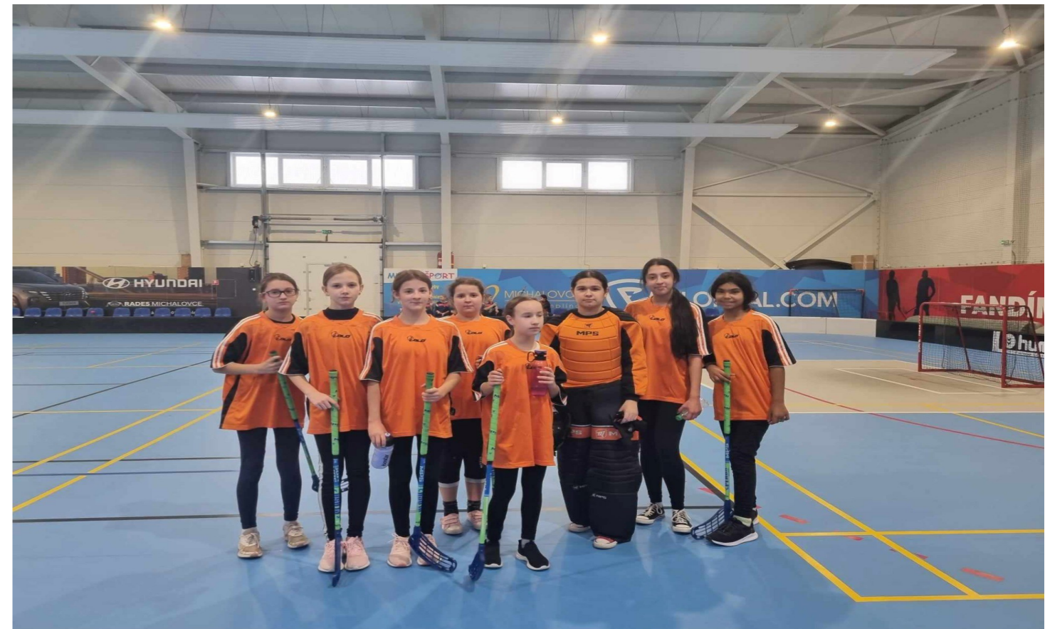
Okresné kolo vo florbale dievčat